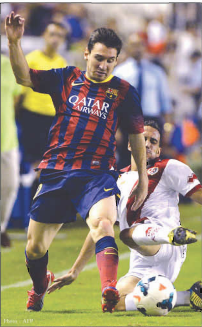
ဗယ်လက်ကာနီ-ဘာစီလိုနာပွဲမှ အကြိတ်အနယ်မြင်ကွင်းတစ်ခု

ဘာစီလိုနာအသင်းနည်းပြအဖြစ် စတင်တာဝန်ယူနေသည့် နည်းပြဟောင်းသည် တရားဝင် ပြိုင်ပွဲ(၈)ပွဲအထိ ကိုင်တွယ်ထားပြီး အဆိုပါပွဲများတွင် ယခင်နည်းပြများနှင့်မတူညီသည့် နည်းဗျူဟာကိုကျင့်သုံးနေခြင်းဖြစ်သည်။ ၎င်းလက်ထက်တွင် ဘာစီလိုနာ၏ပိုင်ဆိုင်မှု မည်ကောက်စားဟန် တိကျတာကာကို စွန့်လွှတ်ဖွယ်ရှိကြောင်း သတင်းများထွက်ပေါ်လာပြီးနောက်ပိုင်း ယခုကဲ့သို့(၅)နှစ်အတွင်း ပထမဆုံးအကြိမ်ဘောလုံးပိုင်ဆိုင်မှု အသစ်မရသည့်မှတ်တမ်းကို ပိုင်ဆိုင်ခဲ့ခြင်းလည်းဖြစ်သည်။ ဗယ်လက်ကာနီနှင့်ပွဲစဉ်တွင်လည်း ကွင်းလယ်ဗဟိုနေရာ၌ ဆောင်းအားသုံးစွဲခဲ့သည့်အတွက် ဘောလုံးပိုင်ဆိုင်မှု အသစ်မရခဲ့ခြင်းဖြစ်နိုင်ကြောင်း မီဒီယာများကသုံးသပ်ခဲ့ကြသည်။ ရာသီကြိုကာလတွင် နည်းပြဟောင်းကန့်သတ်ခဲ့သော်လည်း လာလီဂါရာသီအစ(၅)ပွဲနှင့် ချန်ပီယံလိဂ်(၁)ပွဲတို့တွင် ရာနန်းပြည့်နိုင်ပွဲများရယူနိုင်ခဲ့သည်။ ဘာစီလိုနာအသင်း နောက်ဆုံးအကြိမ် ဘောလုံးပိုင်ဆိုင်မှုအသစ်မရခဲ့သည့်ပွဲမှာ ၂၀၀၈ ခုနှစ်၊ မေလ(၇)ရက်နေ့က ရီးယဲလ်အား(၄-၁)ဂိုးဖြင့် ရှုံးနိမ့်ခဲ့သည့်ပွဲတွင်ဖြစ်ကြောင်း သိရသည်။