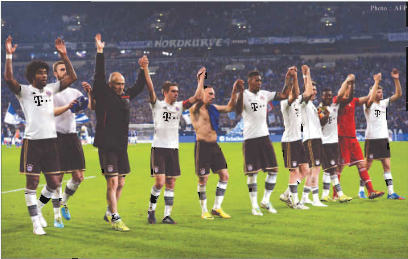
ရှေ့လှမ်းကင်းမဲ့စွာ ဂိုးပြတ်အနိုင်ရပြီးနောက် အောင်ပွဲခံနေသည့် ဘောယန်မြို့နယ်အသင်းသားများ

ဘွန် ဒစ် လီ ဂါ ပွဲ စဉ် (၆) သုံး သပ် ချက်