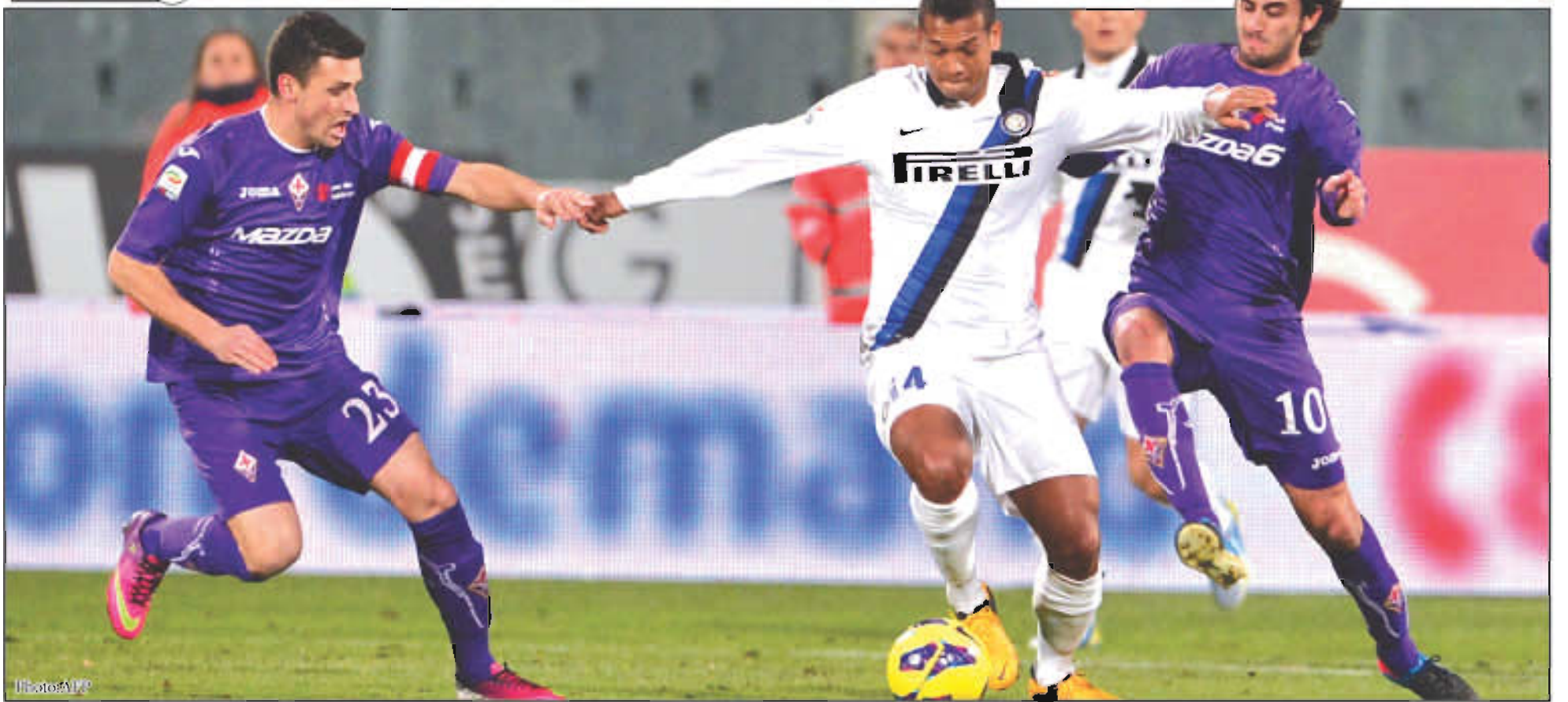
နည်းပြဟက်လာရိုလက်ထက်တွင် ရာသီအစ ရလဒ်ကောင်းများရရှိနေသည့် အင်တာမီလန်အသင်း ပြီးခဲ့သည့်ရာသီက ဗီအိုရင်တီးနားအသင်းနှင့် ဆုံတွေ့ခဲ့စဉ်