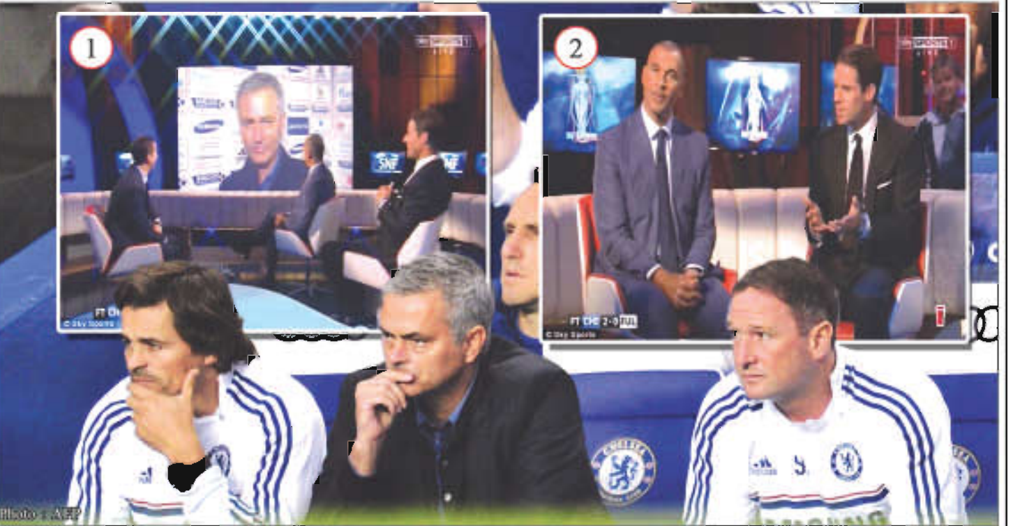
ရုပ်သံမှတစ်ဆင့် ရက်နက်စ်၏မေးမြန်းမှုကို မော်ရင်ဟိုဖြေကြားနေစဉ်(ပုံ-၁)၊ Sky Sports စတူဒီယိုထဲတွင် အတူရှိနေသည့် ဂူးလစ်နှင့်ဂျေမီရက်နက်စ်(ပုံ-၂)