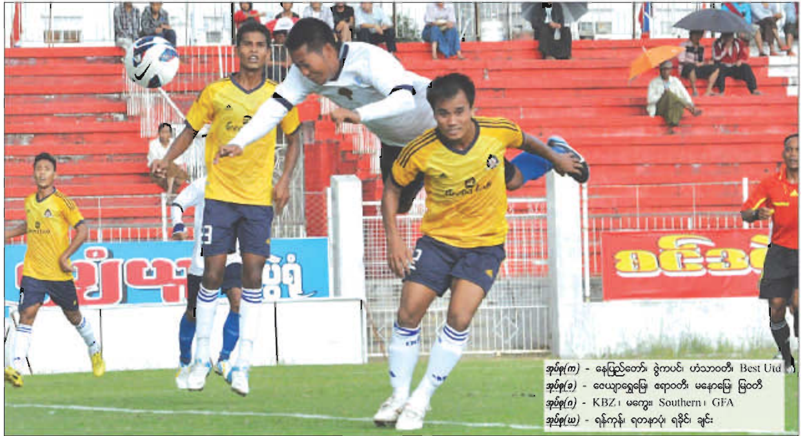
အုပ်စု(က) - နေပြည်တော်၊ ဇွဲကပင်၊ ဟံသာဝတီ၊ Best Utd အုပ်စု(ခ) - လေယာရွှေမြေ၊ ဧရာဝတီ၊ မနောမြေ၊ မြဝတီ အုပ်စု(ဂ) - KBZ၊ မကွေး၊ Southern၊ GFA အုပ်စု(ဃ) - ရန်ကုန်၊ ရတနာပုံ၊ ရခိုင်၊ ချင်း

၂၀၁၃ MNL Cup ပြိုင်ပွဲ အုပ်စုပွဲစဉ်များ သုံးသပ်ချက်