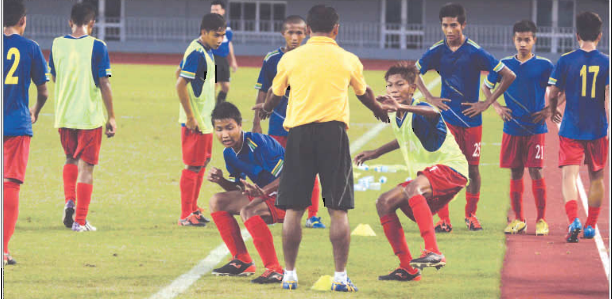
ပြီးခဲ့သည့်ဩဂုတ်လအတွင်း မြန်မာနိုင်ငံကအိမ်ရှင်အဖြစ်လက်ခံကျင်းပခဲ့သည့် ၂၀၁၃ အာရှယူ-၁၆ ပြိုင်ပွဲကိုဝင်ရောက်ယှဉ်ပြိုင်ခဲ့စဉ်ကတွေ့ရသည့် မြန်မာယူ-၁၆ လူငယ်အသင်း