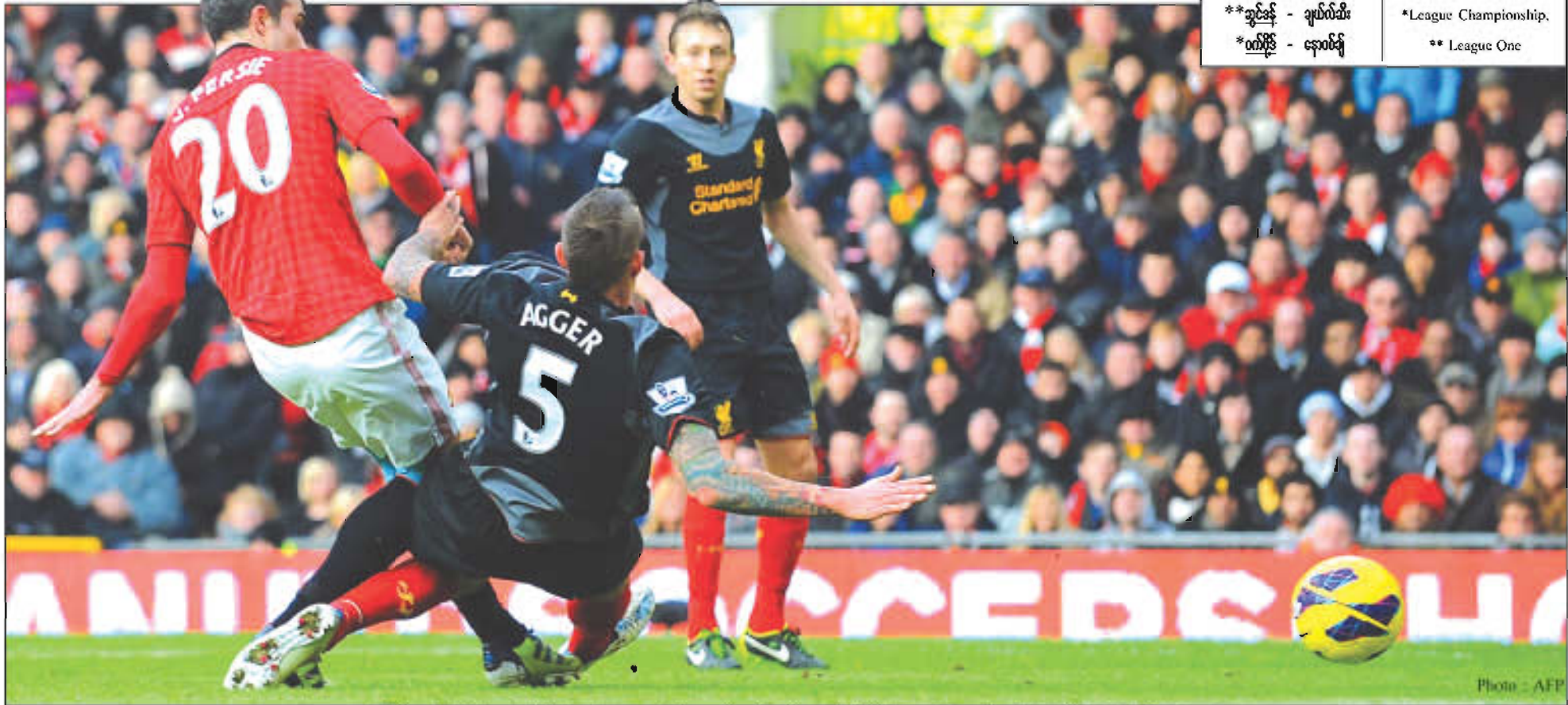
ယမန်နှစ်ရာသီ အိုးလ်ထရက်ဖီဒ်ကွင်းတွင် တွေ့ဆုံစဉ်က မန်ယူတိုက်စစ်မှူး ဗန်ပါနီ လီဗာပူးလ်အသင်းဘက်သို့ ဂိုးသွင်းရန် ကြိုးပမ်းနေစဉ်