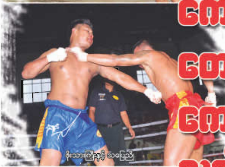
ဖိုးသားကြီးနှင့် သပြေညို