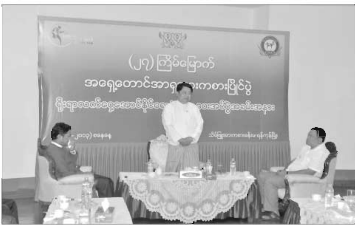
အားကစားဝန်ကြီးဌာန ပြည်ထောင်စုဝန်ကြီးဦးတင်ဆန်းကို မြန်မာ့ရိုးရာလက်ဝှေ့အဖွဲ့ချုပ်ထောက်ပံ့ငွေပေးအပ်ပွဲ၌ တွေ့ရစဉ်

စက်တင်ဘာလ(၂၁)ရက်က ရန်ကုန် မြို့ သိမ်ဖြူအားကစားရုံတွင်ကျင်းပခဲ့သော မြန်မာ့ရိုးရာလက်ဝှေ့အဖွဲ့ချုပ်သို့ ထောက်ပံ့ ငွေပေးအပ်ပွဲအခမ်းအနားတွင် အားကစား ဝန်ကြီးကပြောကြားခဲ့ခြင်းဖြစ်သည်။ ၂၀၁၃ ဆီးဂိမ်းစ်ပြိုင်ပွဲတွင် မြန်မာအားကစားအဖွဲ့ ၏မျှော်မှန်းချက်နှင့်ပတ်သက်၍ “ပြီးခဲ့တဲ့ဆီး ဂိမ်းစ်ပြိုင်ပွဲတုန်းက ကျွန်တော်တို့အဆင့် (၇)နေရာမှာ ရှိခဲ့ပါတယ်။ အဆင့်(၆)နေရာ က ဖိလစ်ပိုင်နဲ့ ရွတ်ဆိပ်ရရှိမှုကွာဟချက် ကြီးမားခဲ့ပြီး ကျွန်တော်တို့နောက်က လာ ခဲ့နဲ့ ကမ္ဘောဒီးယားတို့ ကျော်တက်မသွား အောင် ကြိုးပမ်းခဲ့ရတဲ့အနေအထားမှာရှိပါ တယ်။ ၂၀၁၁ ဆီးဂိမ်းစ်ပြိုင်ပွဲက အနေအ ထားကိုကြည့်မယ်ဆိုရင် ၂၀၁၃ ဆီးဂိမ်းစ် မှာ အဆင့်(၅)၊ အဆင့်(၆)လောက်ရရင်ပဲ ကျေနပ်ရမယ့် အနေအထားဖြစ်ပါတယ်။ ဒါပေမဲ့ ကျွန်တော်တို့အနေနဲ့ ရွတ်ဆိပ် (၁၀၀)ဆွတ်ခူးပြီး ထိပ်ဆုံး(၃)နေရာအ တွင်းရပ်တည်နိုင်ဖို့ ပြင်ဆင်ဆောင်ရွက်နေ တာဖြစ်ပါတယ်”ဟု အားကစားဝန်ကြီးဌာနမှ ပြည်ထောင်စုဝန်ကြီးဦးတင်ဆန်းက ပြော