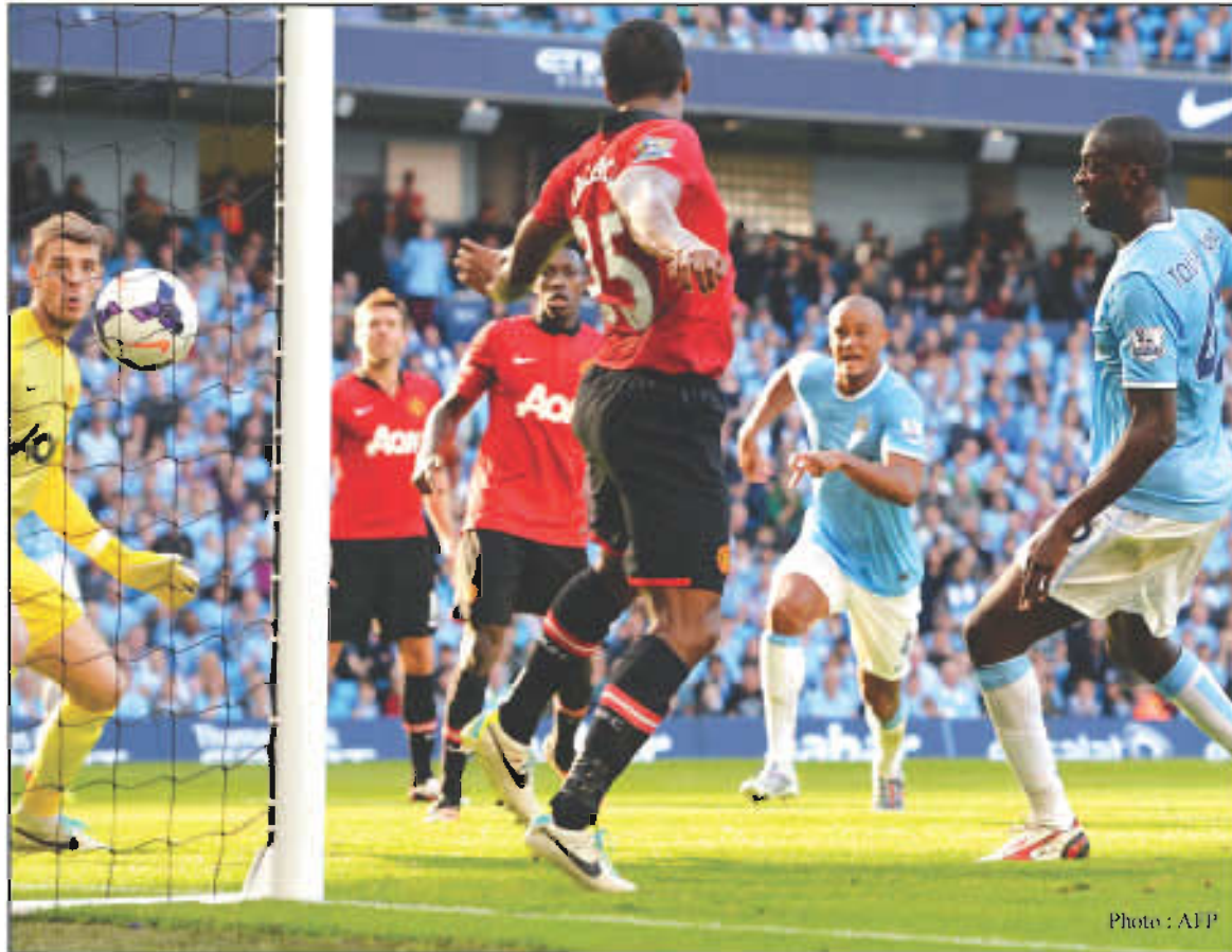
မန်စီးတီးအသင်းအတွက် ဒုတိယပိုင်းကို ယာယာတိုရေး ခူးဖြင့်တိုက်၍ သွင်းယူလိုက်စဉ်