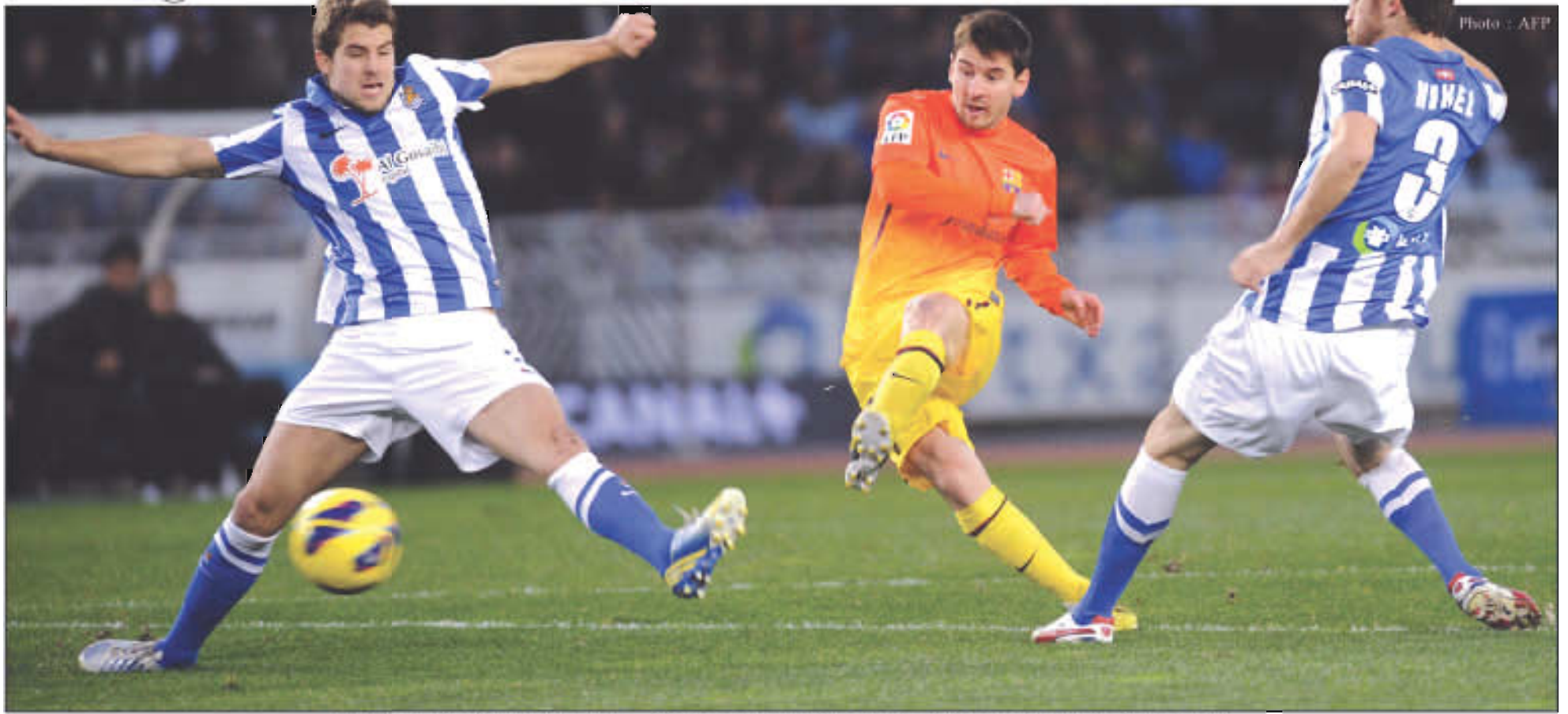
ယမန်နှစ်ရာသီ ဆိုစီဒက်ကွင်းတွင်တွေ့ဆုံခဲ့စဉ်က ဆိုစီဒက်နောက်တန်းအားထိုးဖောက်ခဲ့သွင်းရန်ကြိုးပမ်းနေသည့် ဘာစီလိုနာတိုက်စစ်မှူးမက်ဆီ