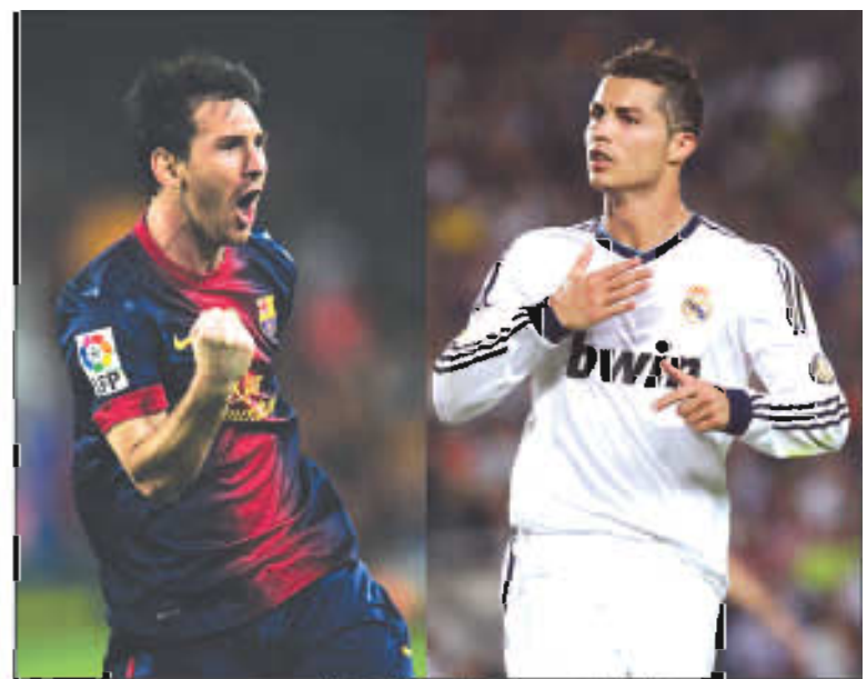
ကမ္ဘာ့လစာအများဆုံးစီရော်နယ်လ်ဒီ(ယာ)နှင့် ရီးယဲလ်အသင်းကစားသမား(ဝဲ)

ရီးယဲလ်မက်ဒရစ်အသင်းတောင်ပံကစားသမား စီရော်နယ်လ်ဒီသည် အမေရိကန်အားကစားပစ္စည်းထုတ်လုပ်ရေးကုမ္ပဏီ Nike နှင့် ပေါင်သန်း(၄၀)တန်စာချုပ်ချုပ်ဆိုရန်နီးစပ်နေကြောင်း သိရသည်။ ပြီးခဲ့သည့်တစ်ပတ်ကမှ အသင်းနှင့်(၅)နှစ်စာချုပ်သက်တမ်းတိုးခဲ့ပြီး တစ်ပတ်လစာပေါင်(၂၈၅၀၀၀)ဖြင့် ကမ္ဘာ့လစာအများဆုံးရရှိသူဖြစ်လာသူ စီရော်နယ်လ်ဒီသည် Nike နှင့်လက်ရှိချုပ်ဆိုထားသောစာချုပ်အရ တစ်နှစ်ပေါင်(၅)သန်း ရရှိနေသူဖြစ်ပြီး ယခုအခါတစ်နှစ်ပေါင်(၈)သန်းဖြင့် (၅)နှစ်ချုပ်ဆိုသွားဖွယ်ရှိနေသည်။