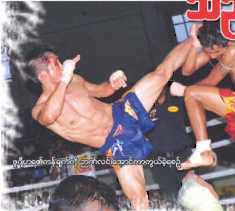
ရုဂျီဟရ၏ကန်ချက်ကို ဉာဏ်လင်းအောင်ကာကွယ်ခဲ့ရစဉ်