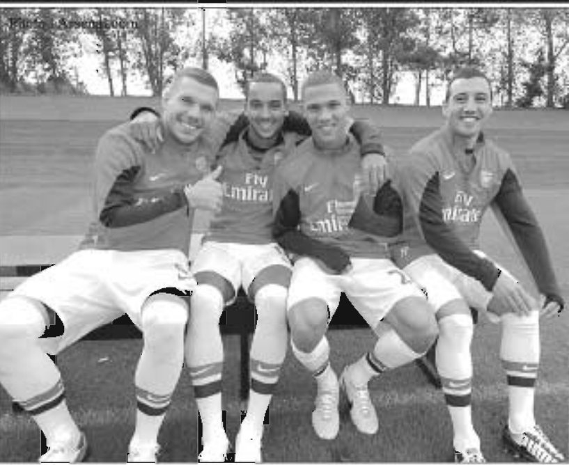
အာဆင်နယ်အသင်းသည် ပြီးခဲ့သည့် တနင်္လာနေ့က အသင်း၏ဘလ္လာရေးရှင်း တမ်းကိုထုတ်ပြန်ခဲ့ရာ ယမန်နှစ်ထက်ဝင်ငွေ တိုးတက်လာခဲ့ကြောင်းသိရှိရသည်။ ၂၀၁၃ မေလအထိ အာဆင်နယ်အသင်း၏ဝင်ငွေ အရပ်ရပ်မှာ ပေါင်(၂၄၂.၈)သန်းရှိခဲ့ပြီး ယ

ဆီးဂိမ်းစ်အကြို အားကစားပြိုင်ပွဲများ အောက်တိုဘာတွင် အပြီးကျင်းပမည် ၂၀၁၃ ဆီးဂိမ်းစ်ပြိုင်ပွဲအကြိုပြိုင်ဆင် မှုအဖြစ်ကျင်းပသည့် နိုင်ငံတကာဖိတ်ခေါ် အားကစားပြိုင်ပွဲများကို လာမည့်အောက် တိုဘာလအတွင်း အပြီးသတ်ကျင်းပပြုလုပ် မည်ဖြစ်ကြောင်း သိရှိရသည်။ ၂၀၁၃ ဆီး ဂိမ်းစ်ပြိုင်ပွဲတွင်ပါဝင်သည့် အားကစားနည်း များအနက် အားကစားနည်းအချို့၏ ဆီး ဂိမ်းစ်အကြိုပြိုင်ပွဲများကို ရန်ကုန်၊ နေပြည် တော်နှင့် ငွေဆောင်ကမ်းခြေတို့တွင် ကျင်း ပပြုလုပ်ခဲ့ပြီးဖြစ်သည်။ ကျန်ရှိနေသေးသော အားကစားနည်းများအနက် ပြေးခုန်ပစ်၊ ဘော်လီဘော၊ ဂိုက်ကျော်ခြင်း၊ ရေကူး၊ ရိုး ရာလှေလှော်အားကစားနည်းတို့၏ နိုင်ငံ တကာဖိတ်ခေါ် ပြိုင်ပွဲများကို အောက်တို ဘာလအတွင်း နေပြည်တော်၌ ကျင်းပပြု လုပ်ရန်စီစဉ်ထားကြောင်း သိရသည်။