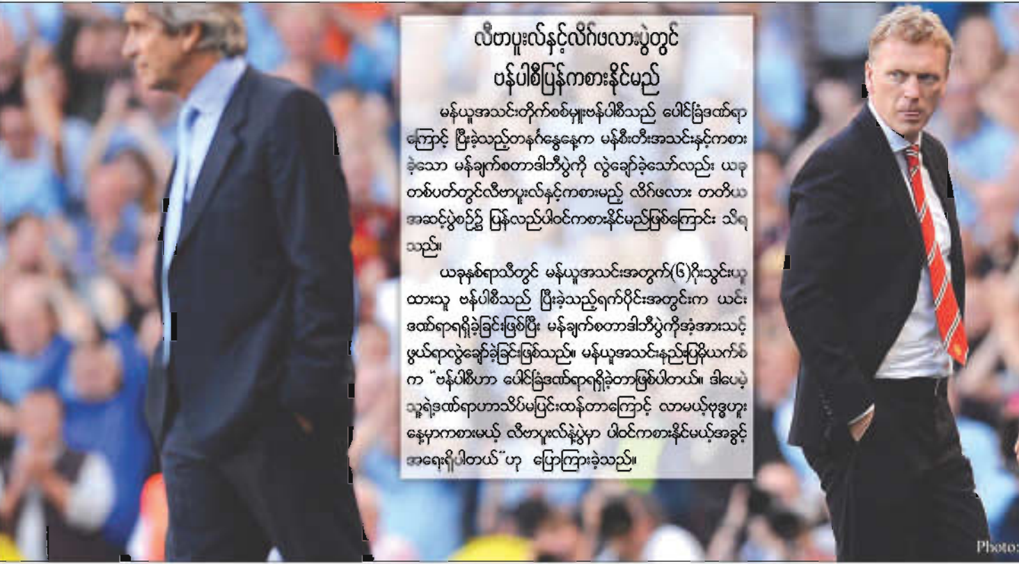
မန်ချက်စတာအိဘီပွဲတွင် စိတ်ပျက်စရာရလဒ်နှင့်ကြုံတွေ့ခဲ့ရသည့် မန်ယူနည်းပြမိုယက်စ်(ယာ)

ပယ်လီဂရီနိုကို လက်စားမချေနိုင်ခဲ့သည့် မိုယက်စ် မန်ယူအသင်း နည်းပြမိုယက်စ်သည် အဲဗာတန်အသင်းကိုကိုင်တွယ်ခဲ့စဉ် ၂၀၀၅ ခုနှစ်အတွင်းက ပယ်လီဂရီနိုကိုကိုင်တွယ်နေသည့် ဗီလာရီးယယ်နှင့် ချန်ပီယံလိဂ်ခြေစစ်ပွဲ Play-Offs အဆင့်တွင်ဆုံတွေ့ခဲ့ကြသည်။ ယင်းပွဲတွင် အဲဗာတန်အသင်းမှာ အိမ်ကွင်း၌(၂-၁)ဂိုးဖြင့်ရှုံးနိမ့်ခဲ့သလို၊အဝေးကွင်းတွင်လည်း (၂-၁)ဂိုးဖြင့်ရှုံးနိမ့်ခဲ့ရာ နှစ်ကျောပေါင်းရလဒ်(၄-၂)ဂိုးဖြင့် ခြေစစ်ပွဲမအောင်မြင်ခဲ့ပေ။ သို့ဖြစ်ရာမိုယက်စ်အနေဖြင့် ယင်းရှုံးကြွေးကိုပြန်ဆပ်မည်ဟု မန်ချက်စတာအိဘီပွဲမတိုင်မီ ကြုံးပါးခဲ့သော်လည်းဂိုးပြတ်ထပ်မံရှုံးနိမ့်ခဲ့ရသည်။