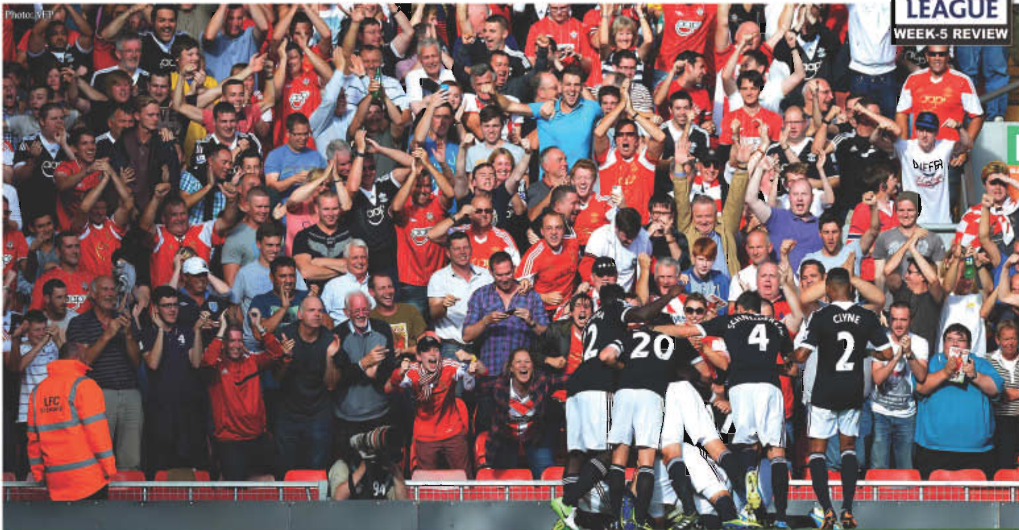
လီဗာပူးလ်အသင်းဘက်သို့ တစ်လုံးတည်းသော အနိုင်ရိုးသွင်းယူပြီးနောက် အောင်ပွဲခံနေသည့် အောက်သမ်တန်အသင်းသားများ

ချယ်လ်ဆီးရဲ့ ပထမပိုင်းကစားပုံကအားရ စရာမရှိခဲ့ပါဘူး။ ဒုတိယပိုင်းရောက်မှ ပုံစံကောင်း ကို ပြသနိုင်ခဲ့တာဖြစ်ပြီး နိုင်ပွဲအတွက်ထိုက်တန် တဲ့ ခြေစွမ်းကိုပြသနိုင်ခဲ့တာပါ။ ပွဲကိုထိန်းချုပ် ထားနိုင်ခဲ့တယ်ဆိုပေမယ့် ပထမပိုင်းမှာ ချယ်လ် ဆီးကစားပုံက ရိုးစင်းပဲပြီး အင်အားမရှိပါဘူး။ (၆၀)ရာခိုင်နှုန်းအထက်အသာရထားတဲ့ ချယ်လ် ဆီးကစားကွက်က ခံစစ်မှာပဲ ဘောလုံးအပေး များပြီး ထိရောက်တဲ့ တိုက်စစ်လမ်းကြောင်းတွေ မရှိပါဘူး။ အီတူးက အီဗန်နိုဗစ်ရဲ့ ဖြတ်တင် ဘော(၂)ကြိမ်ကိုဖြန့်တီးခဲ့ပြီး ကစားပုံကောင်း တဲ့ ဟာလက်ကလည်း အဝေးကန်ချက်တွေနဲ့