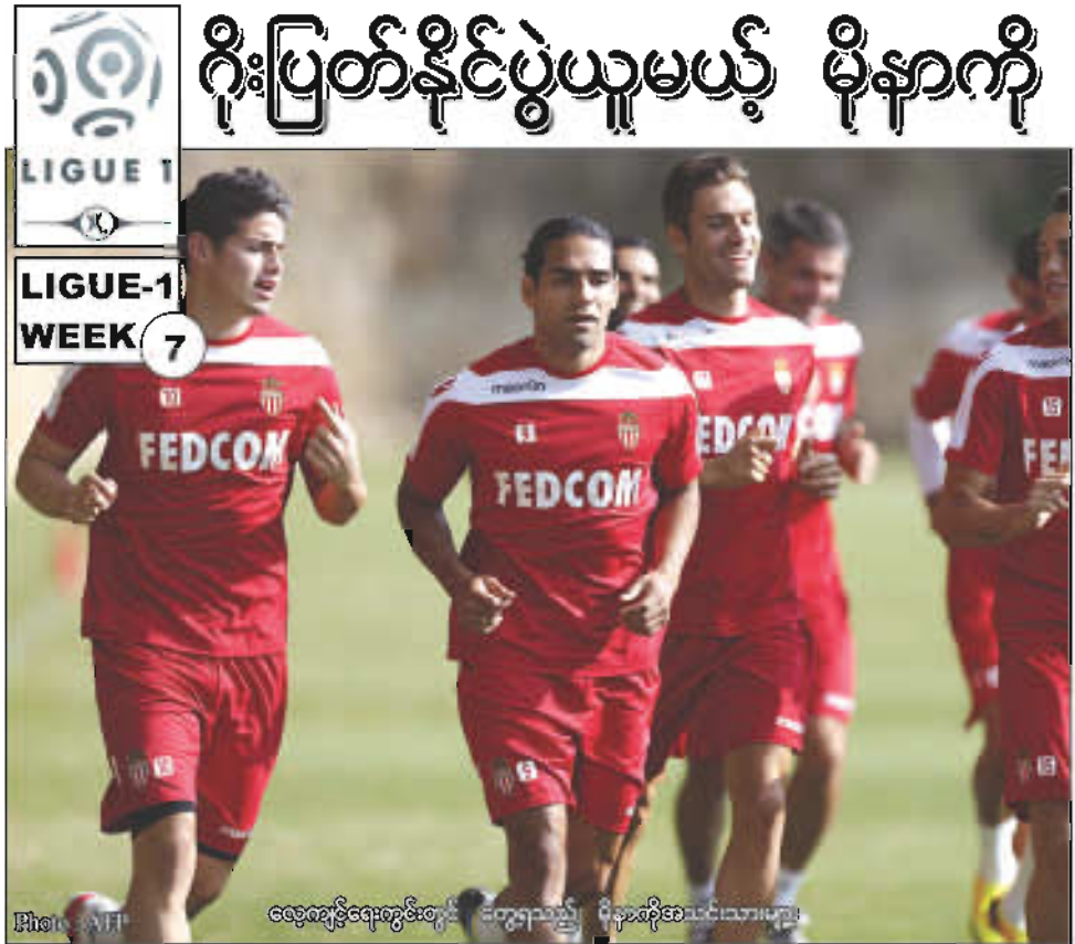
ရွေးချယ်ချီးမြှင့်ရေးကော်မရှင်းက ရွေးချယ်ခဲ့တဲ့ မိနားဆီအသင်းသားများ