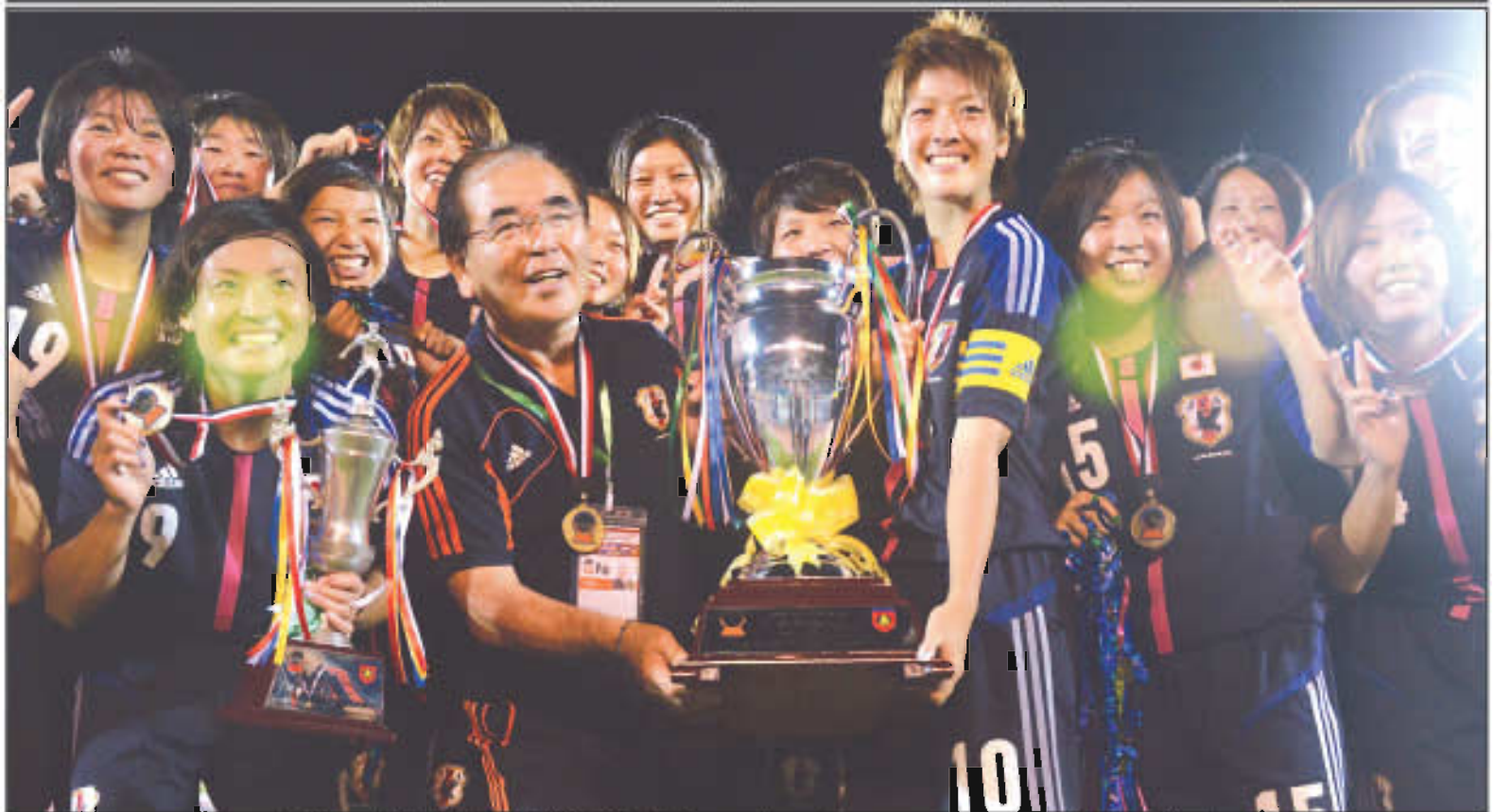
ဩစတြေးလျအသင်းကို ပယ်နယ်တီအဆုံးအဖြတ်ဖြင့်အနိုင်ယူပြီး ချန်ပီယံဆုဖလားနှင့်အတူ ဂျပန်ယူ-၂၃ ကစားသမားများအောင်ပွဲခန့်စဉ်(စာတံဆိပ် - ညီညွတ်စွာ)

အာဆီယံအမျိုးသမီးချန်ပီယံရှစ်ဘောလုံးပြိုင်ပွဲ သုံးသပ်ချက်