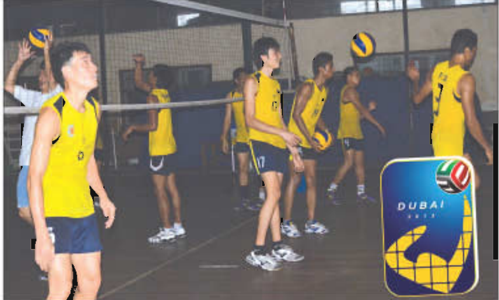
မြန်မာအမျိုးသားဘော်လီဘောအသင်းမှ လေ့ကျင့်နေစဉ်

ကာ ကစားစေမည်ဖြစ်ကြောင်းသိရသည်။ မြန်မာဘော်လီဘောအသင်းသည် အုပ်စုအဖွင့်ပွဲစဉ်အဖြစ် စက်တင်ဘာ(၂၈)ရက်တွင်ဘာဂီနီအသင်းနှင့် စတင်ကစားမည်ဖြစ်သည်။