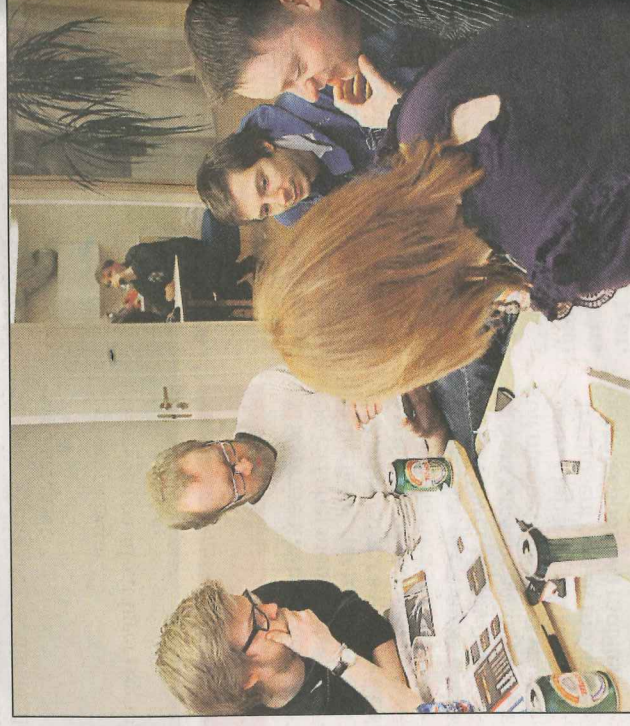
TENKER: «Grunker & Gryn» kom til kort i går, med 50 av 75 mulige poeng.

■ Lokaloppgjøret endte 65-50 i Folkeaksjonens favør, av 75 mulige poeng.